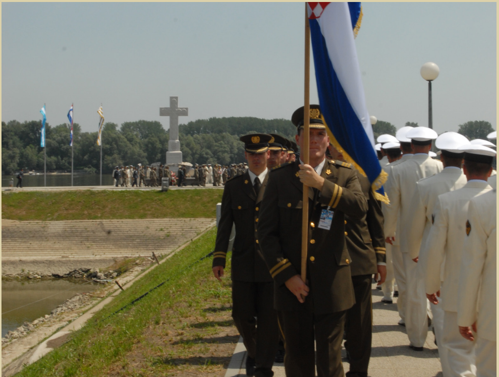
Svečanost završetka izobrazba na HVU-u u Vukovaru, 2007.

Zapovjedno stožerna škola dobila je ime po Blagi Zadri, legendarnom branitelju Vukovara, koji je poginuo 1991.