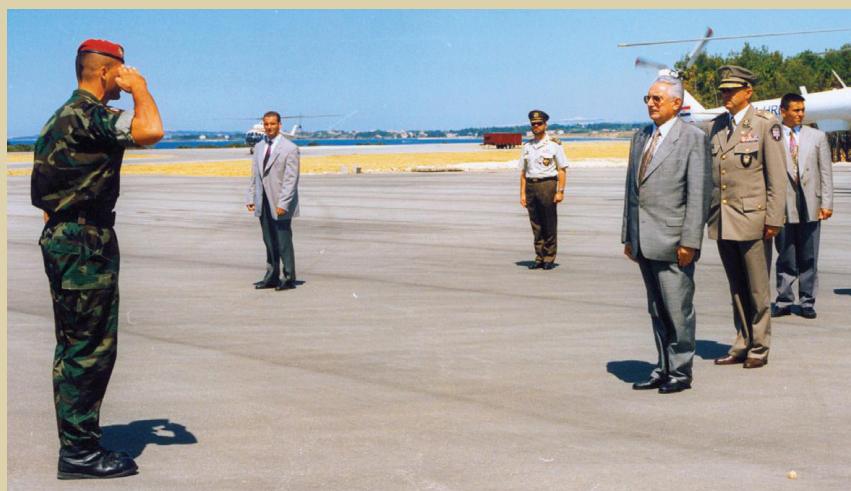
Vrhovni zapovjednik dr. Franjo Tuđman, Zemunik, 1996.