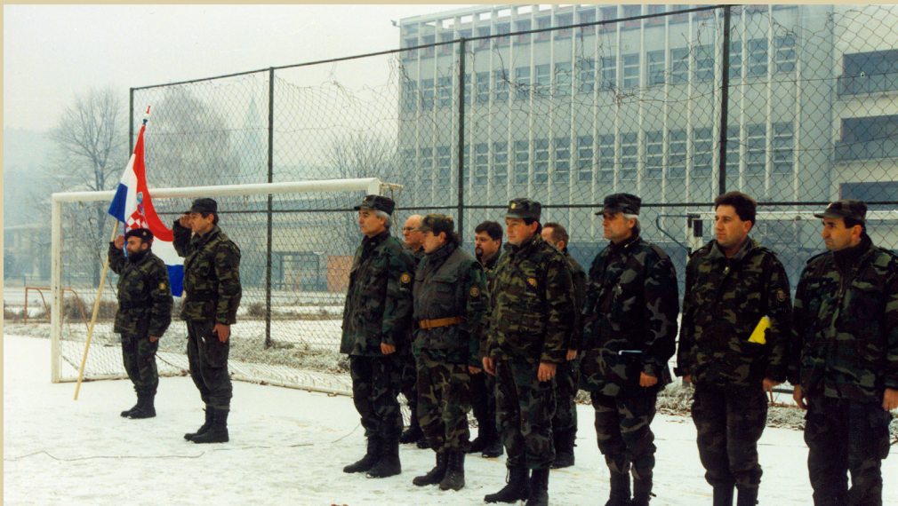
Prisega Hrvatske vojske, 16. prosinca 1991.