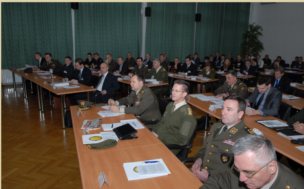
NATO Regional Acquisition Conference, 2010.