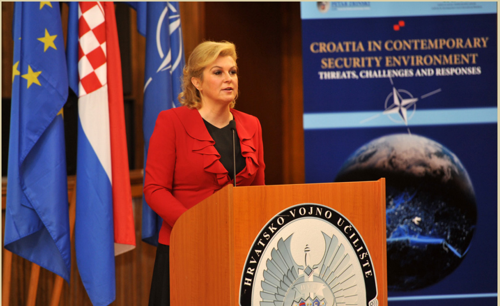
Konferencija „RH u suvremenom sigurnosnom okruženju”, 2015.