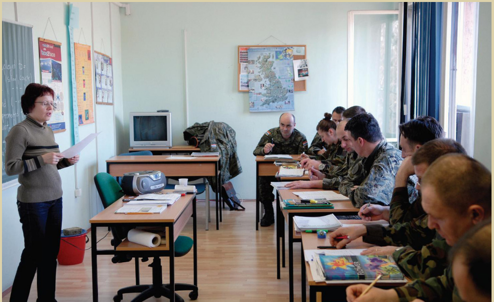
Središte za strane jezike u Splitu