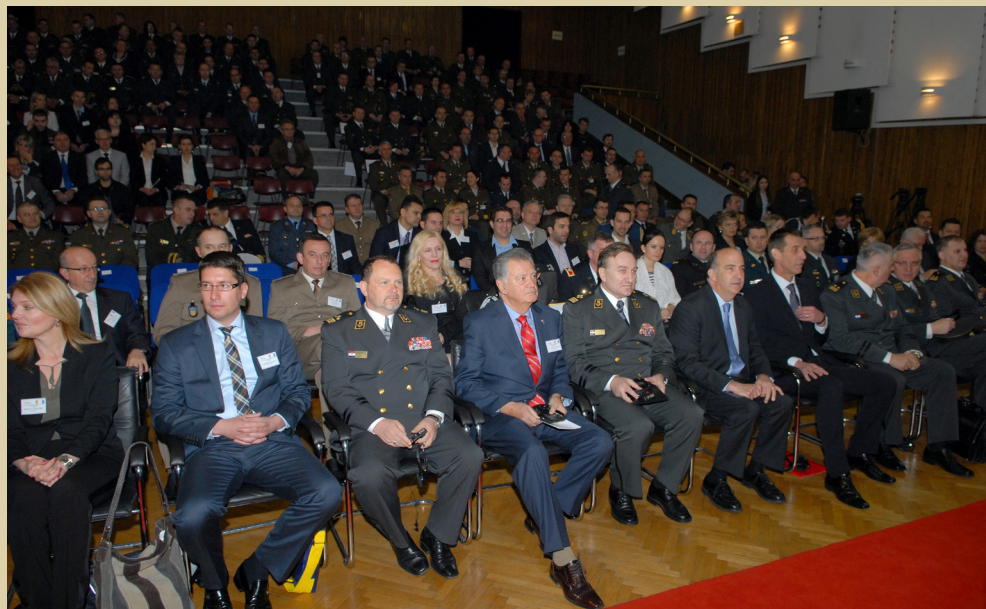
Konferencija u povodu pet godina ulaska RH u NATO, 2014.