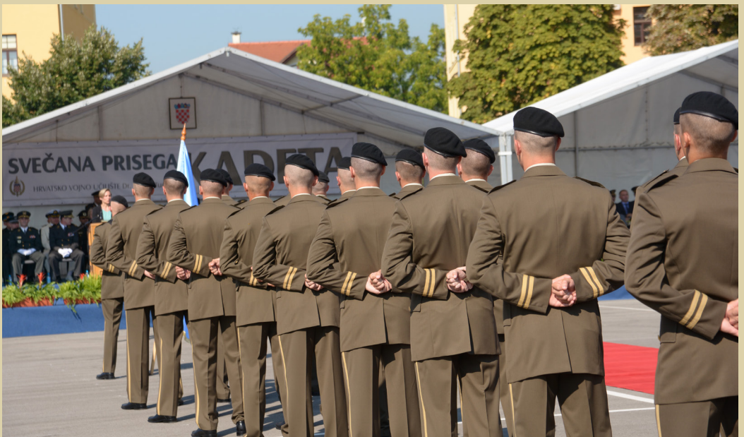
Svečana prisega kadeta, 2016.