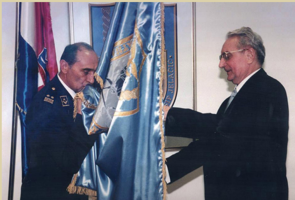
Dr. Franjo Tuđman uručuje zastavu Ratne škole