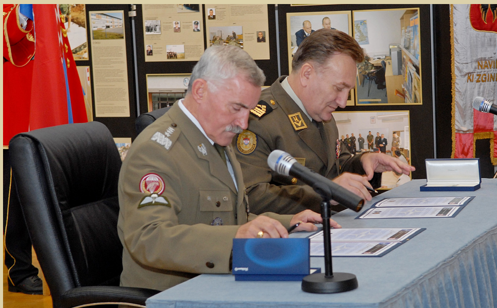
Završena Integracijska konferencija ulaska RH u NATO, 2012.