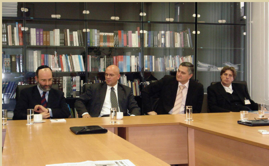
Predavači iz vjerskih zajednica s polaznicima Ratne škole