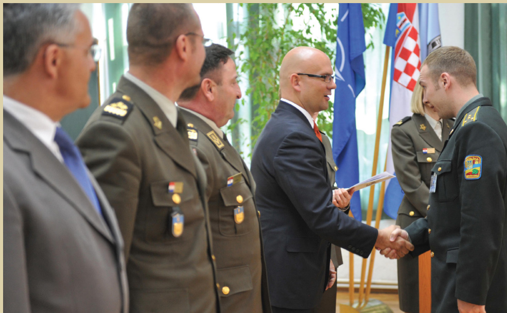
Svečanost završetka X. naraštaja Vojno-diplomatske izobrazbe