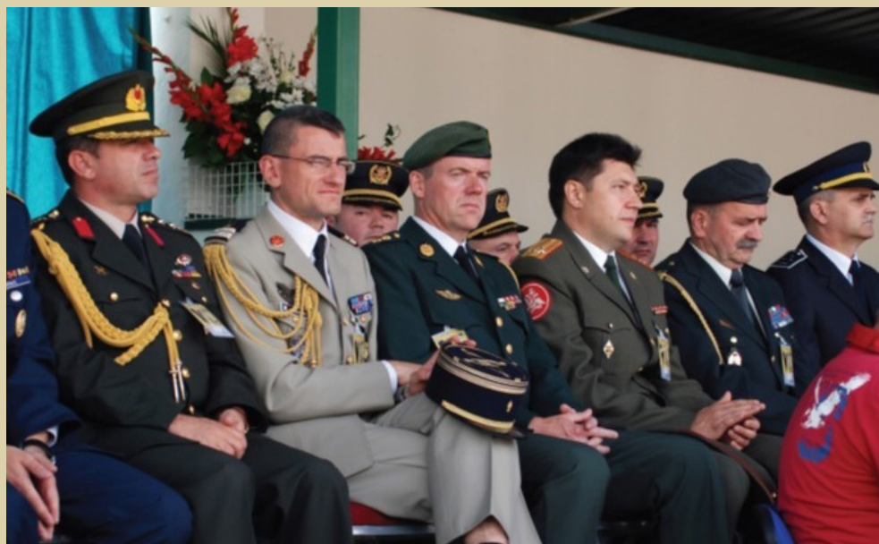
Vojni izaslanici akreditirani u Republici Hrvatskoj na svečanoj promociji polaznika vojnih škola u Vukovaru, 2010.