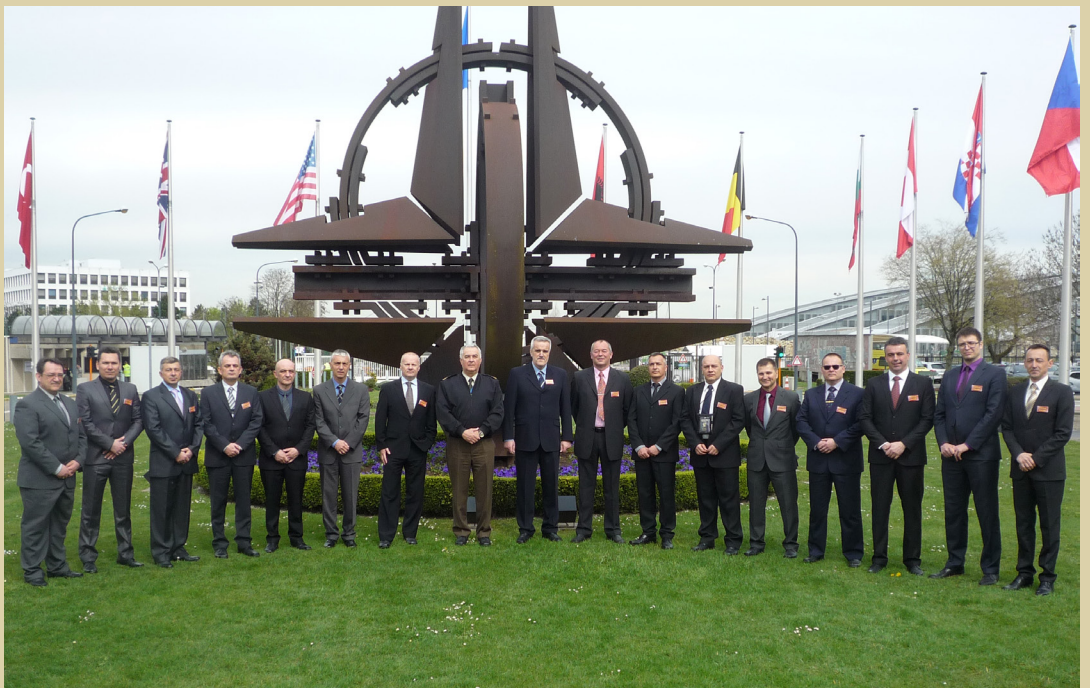
Studijski posjet Ratne škole sjedištu NATO-a u Bruxellesu, 2016.