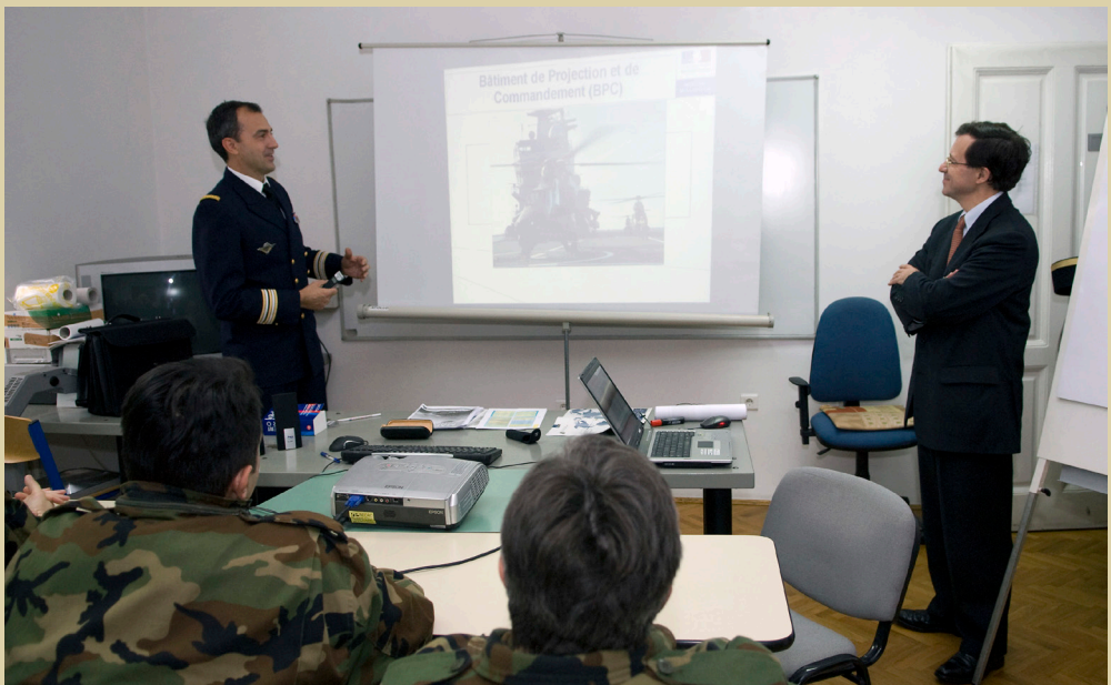
Jérôme Pasquier, veleposlanik Republike Francuske, na nastavi francuskog jezika