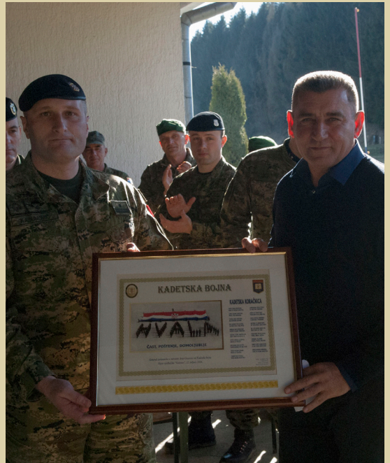
Pripadnici Kadetske bojne s generalom Antom Gotovinom na poligonu Gakovo, 2016.