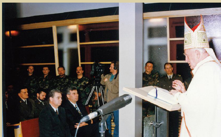
Kardinal Franjo Kuharić posvećuje kapelicu sv. Mihovila Arkandela, 1993.