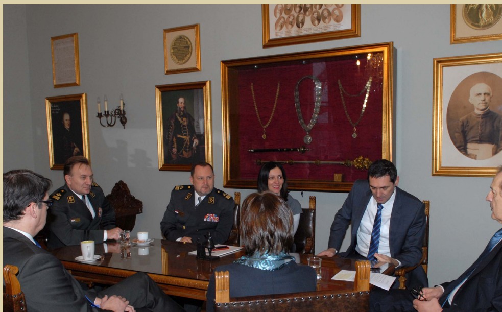
Potpisivanje Sporazuma o ustrojavanju studijskih programa za potrebe OSRH, 2014.