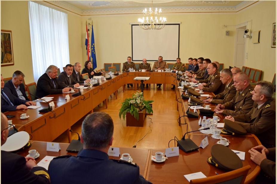
Posjet Ratne škole Saboru RH, 2016.