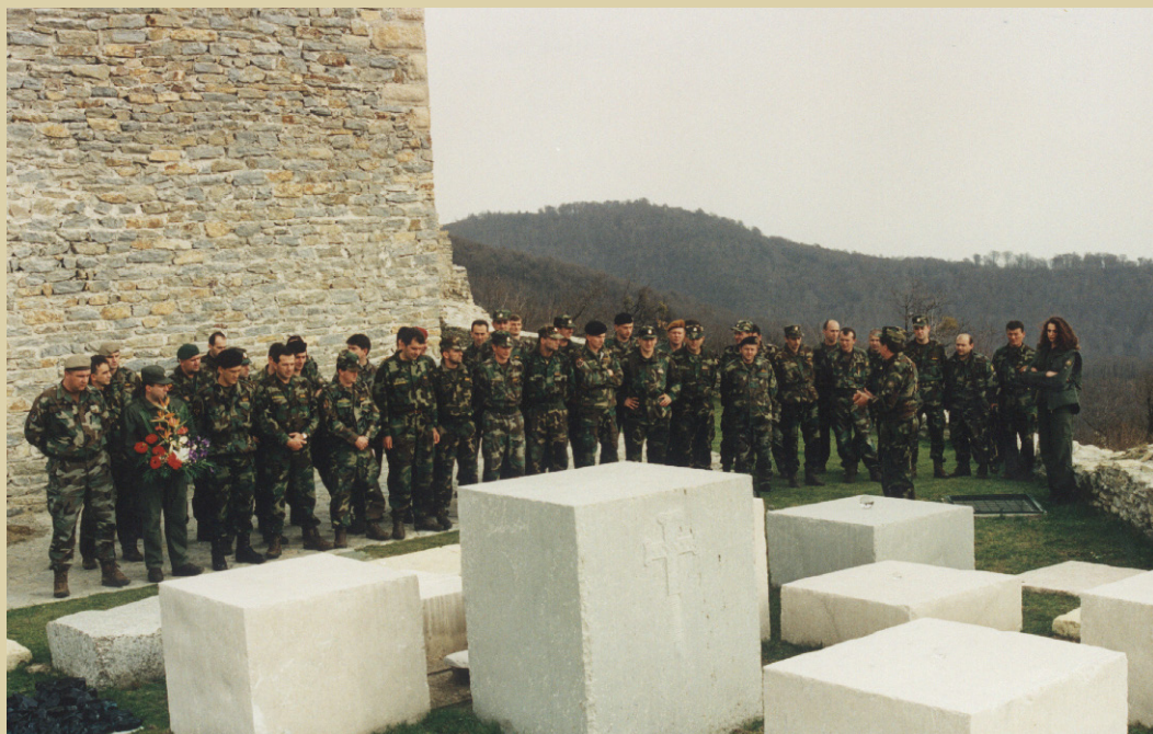
Peti naraštaj Zapovedno stožerne šole na Oltaru domovine, 1997.