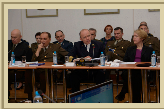
Okrugli stol „Od Domovinskog rata do sveučilišne zajednice”, 2016.