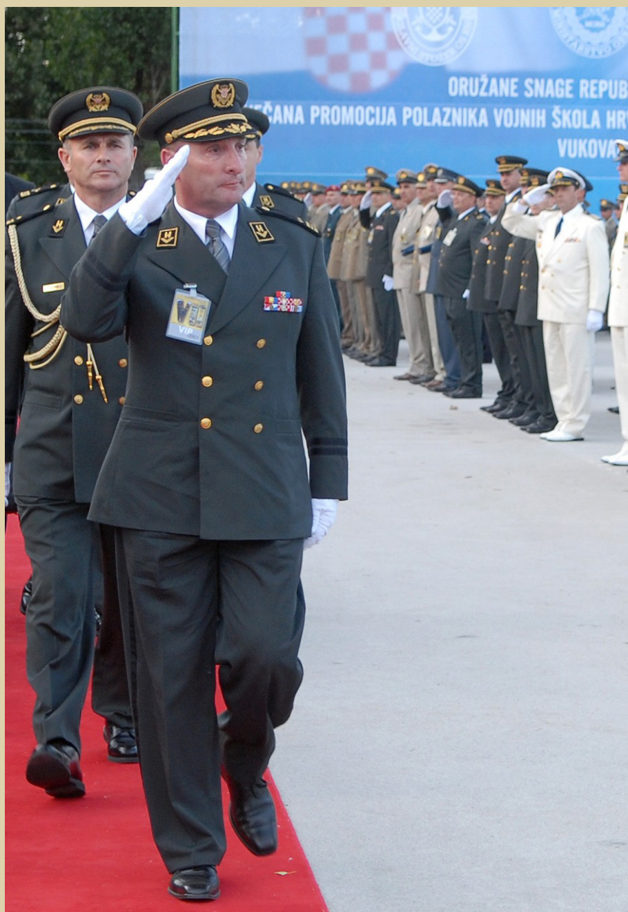
General Šundov na svečanoj promociji polaznika izobrazbi HVU-a u Vukovaru, 2011.