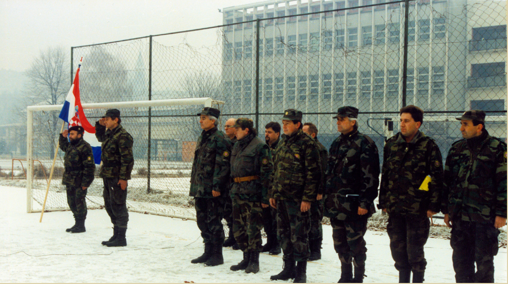
Prisega Hrvatske vojske, 16. prosinca 1991.