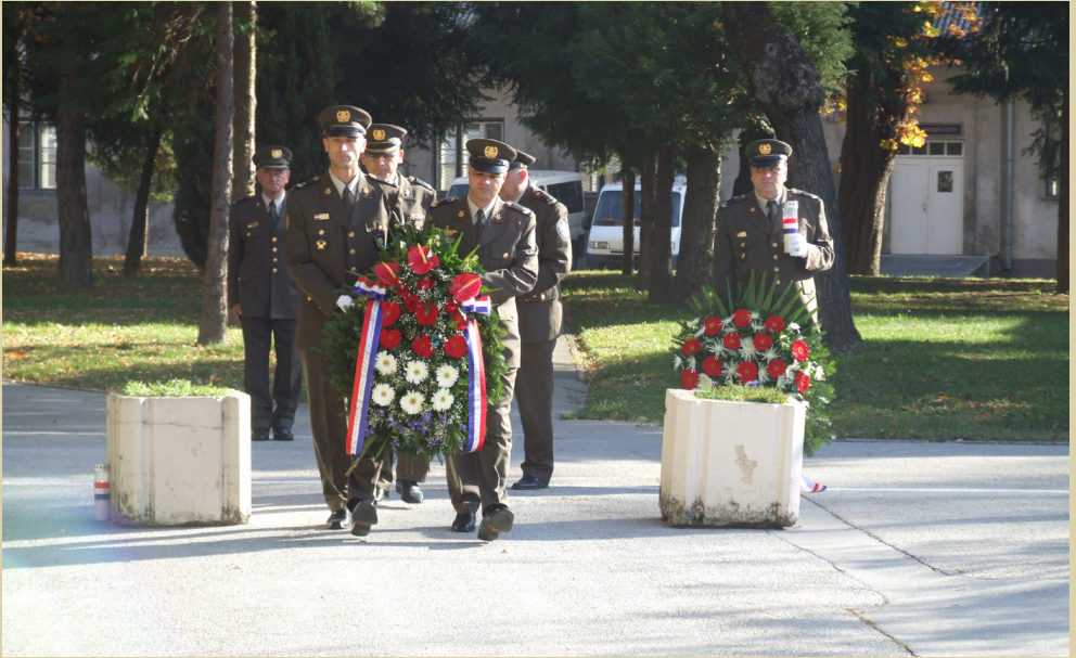
Obilježavanje 21. godišnjice ustroja Dočasničke škole i 17. memorijalni malonogometni turnir „Bojnik Tihomir Klobučar”