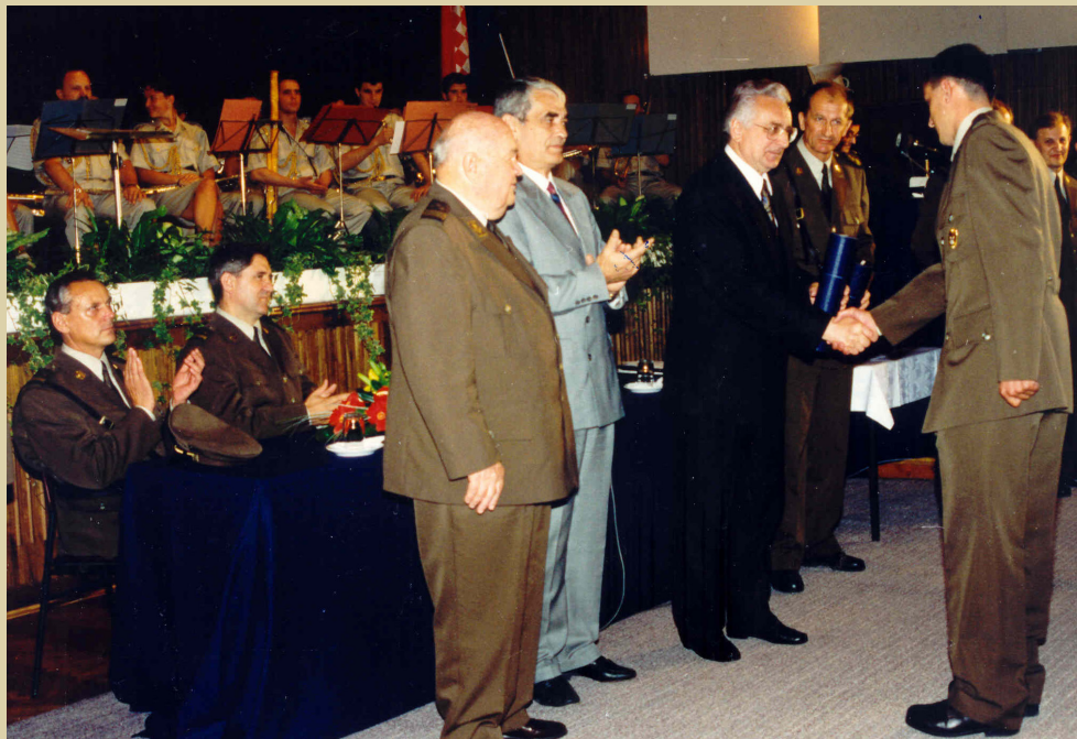
Predsjednik RH dr. Franjo Tuđman, ministar obrane Gojko Šušak, načelnik GS HV-a stožerni general Janko Bobetko, 1993.