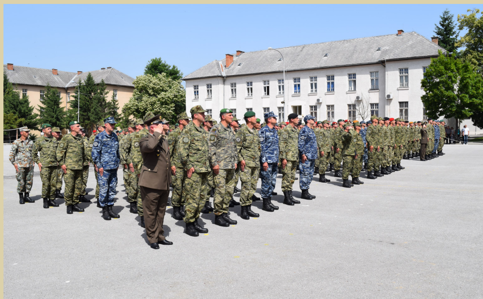
Polaznici Dočasničke škole u Požezi