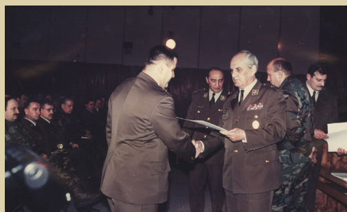
Završetak izobrazbe MPRI, 1996.