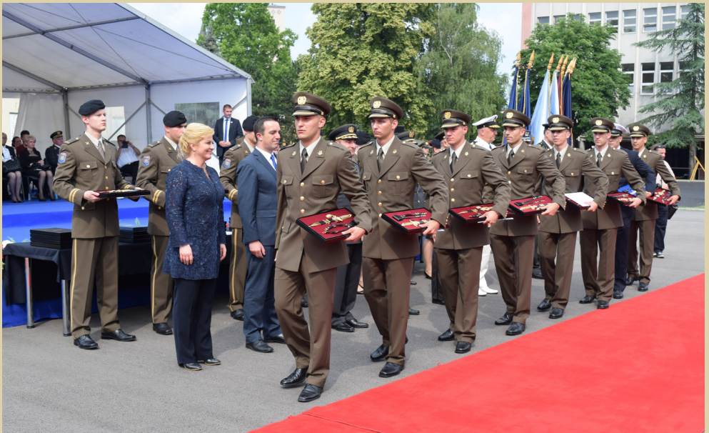
Promocija polaznika Temeljne časničke izobrazbe, 2016.