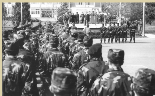
Dočasnička škola HVU-a u Jastrebarskom, 1994.