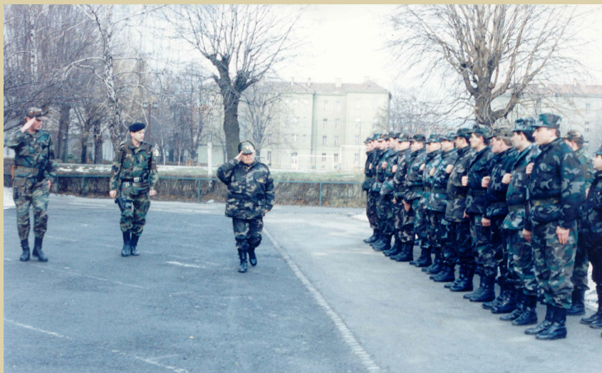
Prvi posjet Učilištu načelnika GS HV-a stožernog generala Janka Bobetka, 1992.