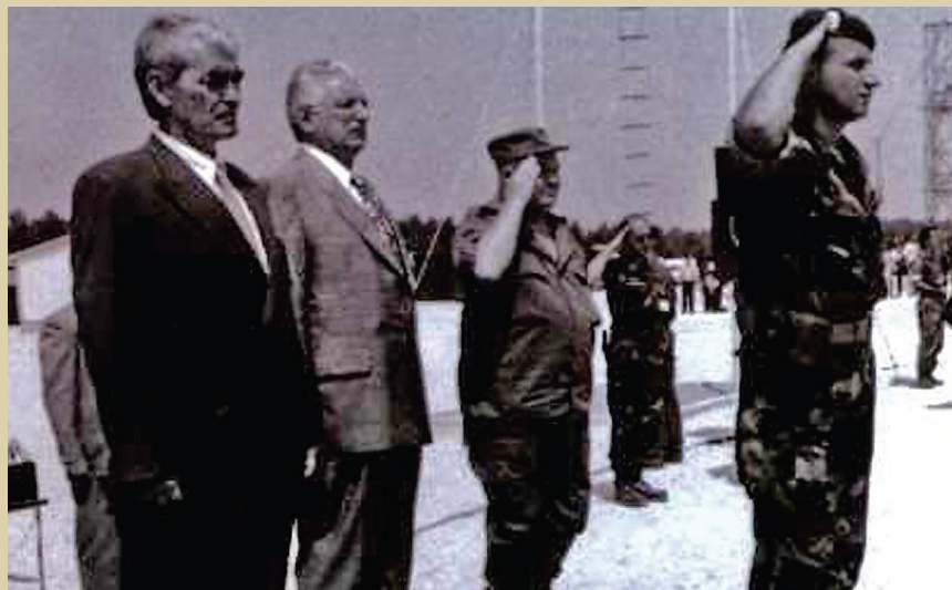
Vojni vrh u Gardijskom središtu 1994.: dr. Franjo Tuđman, Gojko Šušak i generali Janko Bobetko i Ante Gotovina