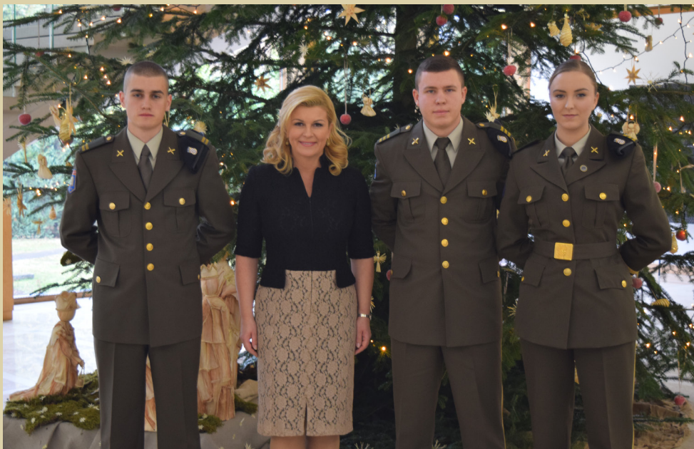
Susret Predsjednice RH s novinarima Hrvatskog kadeta, 2016.