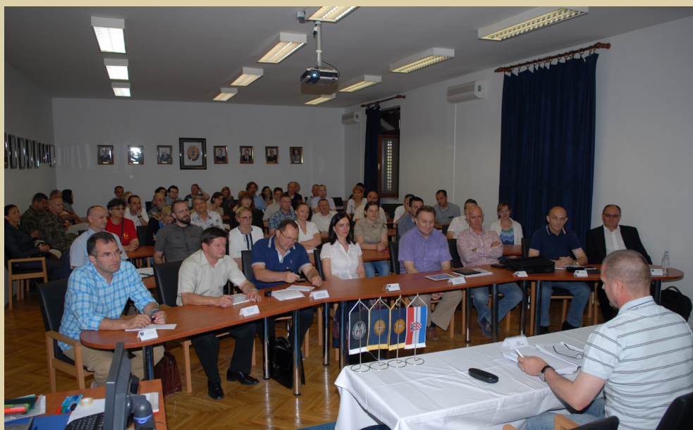
Stručno usavršavanje nastavnika vojnih studija, Mali Lošinj, 2014.