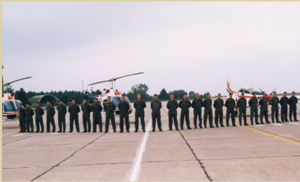
Kadeti 2. naraštaja u zračnoj bazi Zemunik