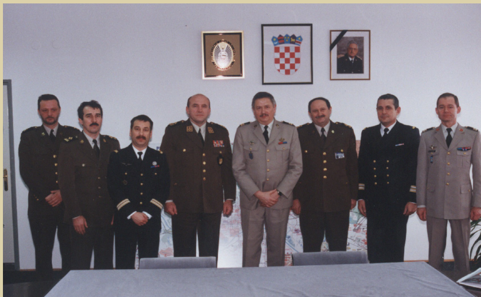
Posjet HVU-u francuskoga vojnog izaslanstva, 2000.