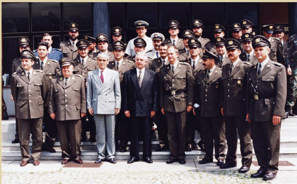
Prvi naraštaj Zapovedno stožerne šole, 1993.