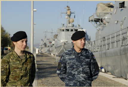
Kadeti u vojarni „Sv. Nikola” u Splitu