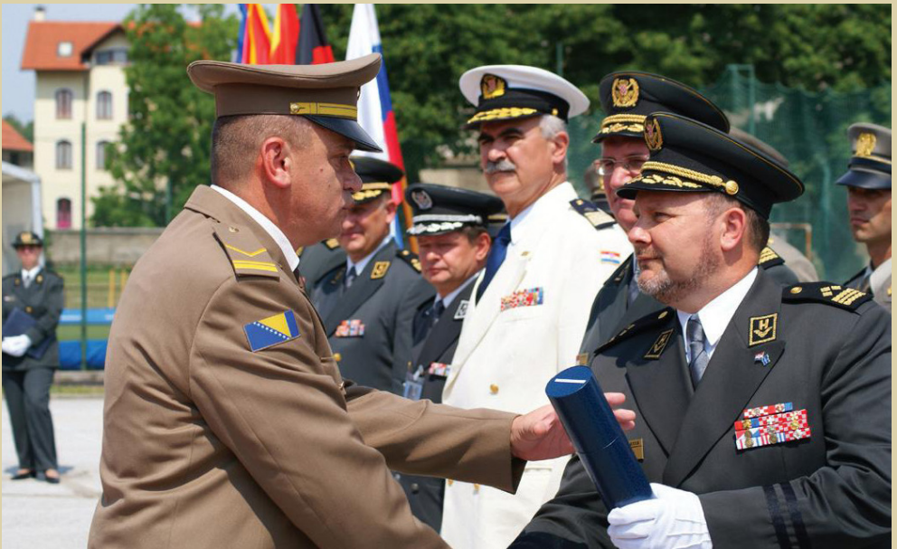
Svečanost promocije polaznika vojnih škola