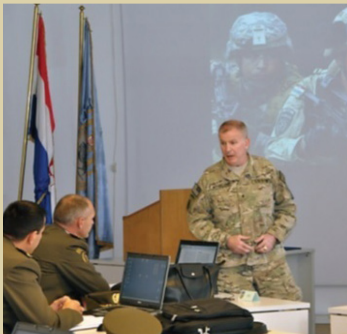
Brigadni general Sean Mulholland, predavanje polaznicima Ratne škole, 2011.