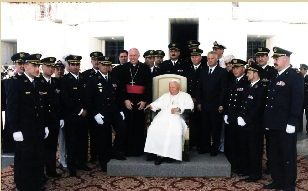
Prilikom posjeta Vatikanu prvi naraštaj Ratne škole primio je u audijenciju papa Ivan Pavao II.