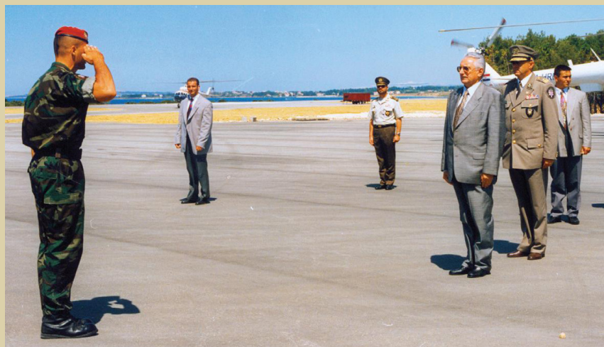
Vrhovni zapovjednik dr. Franjo Tuđman, Zemunik, 1996.