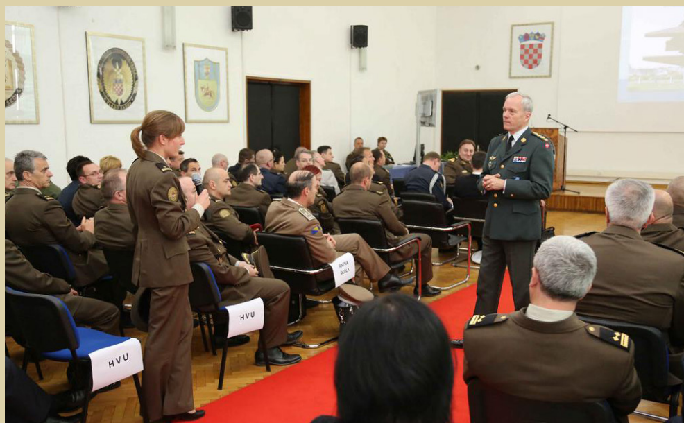
Predavanje gz Knuda Bartelsa, predsjedatelja Vojnog odbora NATO-a, 2013.