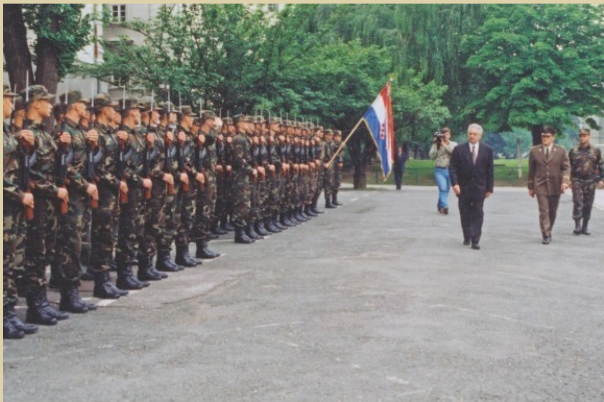
Prvi posjet predsjednika RH dr. Franje Tuđmana HVU-u „Petar Zrinski” prigodom utemeljenja Zapovjedno stožerne škole, 1993.