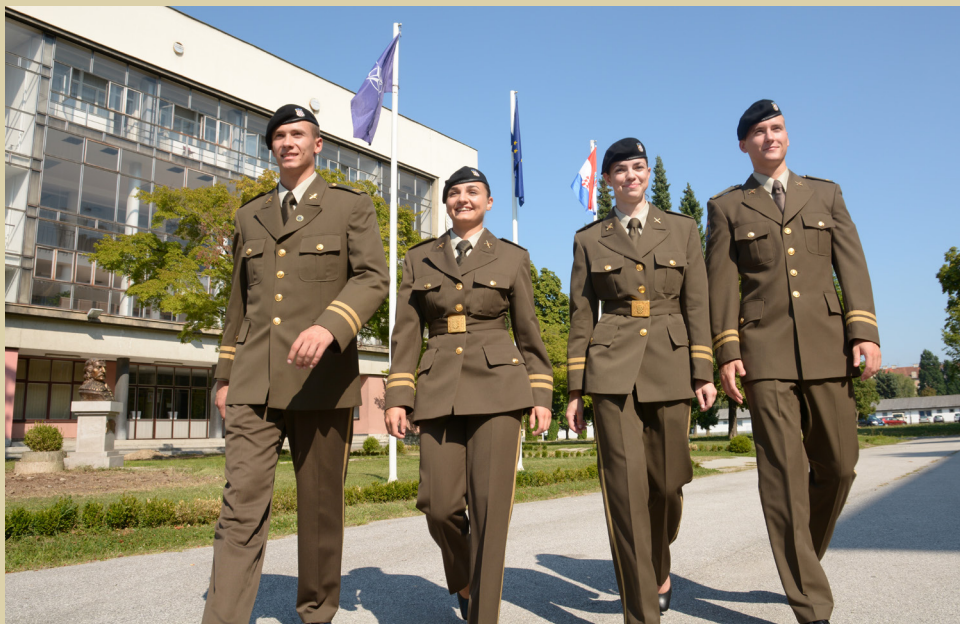
Kadeti Oružanih snaga Republike Hrvatske na HVU-u