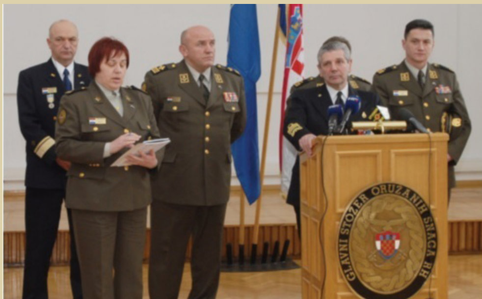
Posjet HVU-u admiralu Giampaola Di Paola, predsjednika Vojnog odbora NATO-a, 2011.