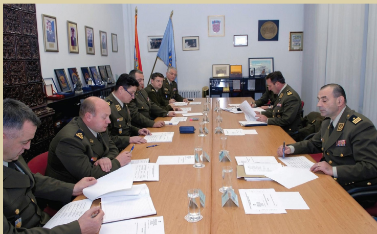
Vijećnica, sjednica Nastavničkog vijeća Ratne škole