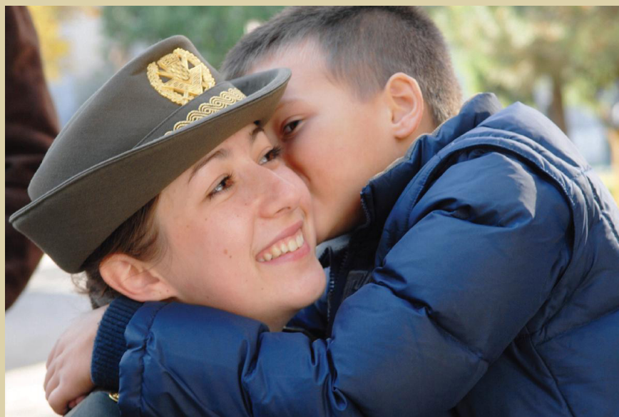
Čestitanja u povodu uručivanja prvoga časničkog čina