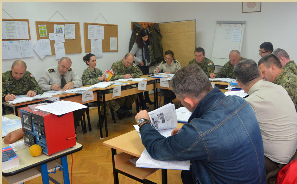
Središte za strane jezike u Zagrebu