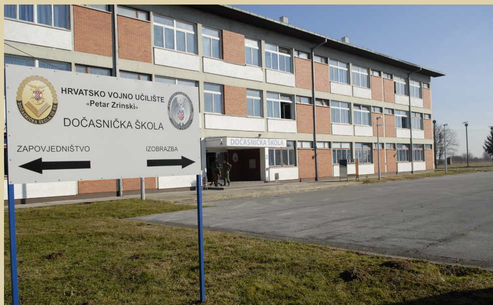
Dočasnička škola u Đakovu, 2011.