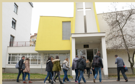
Kapela sv. Mihovila u Vojarni Petar Zrinski