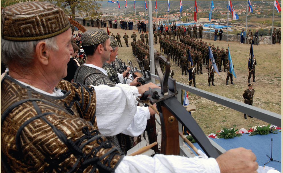
Prisega na Kninskoj tvrđavi ispred povijesnih postrojba, 2009.